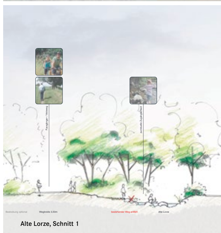
Alte Lorze, Schnitt 1