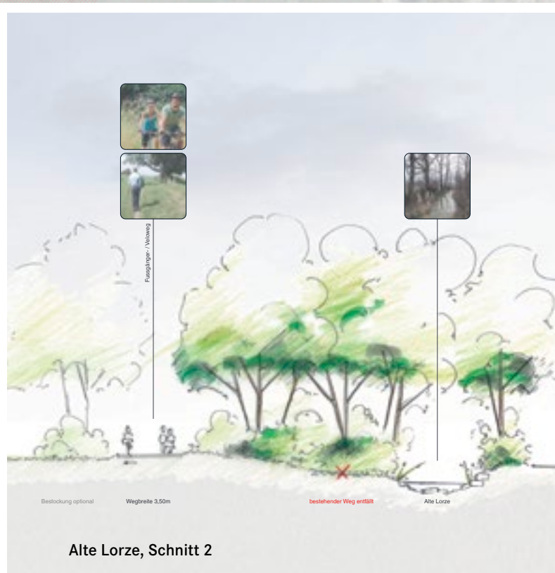
Alte Lorze, Schnitt 2