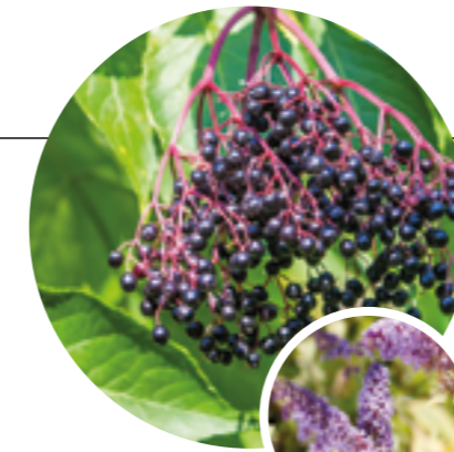
Tipp 3: Holunder statt Sommerflieder