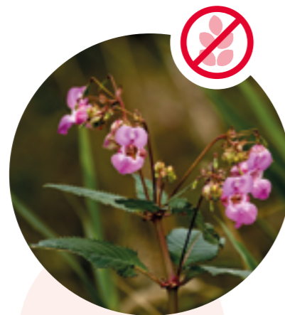
Drüsiges Springkraut Impatiens glandulifera

→ Neuanpflanzung und Verschleppung sind verboten