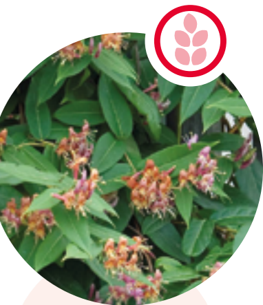
Asiatische Geissblätter Loniceria henryi und japonica

Herkunft: China Blütezeit: Juni bis Juli