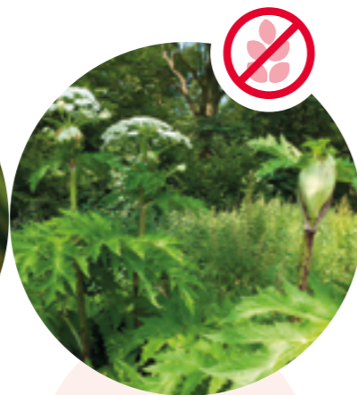
Riesenbärenklau Heracleum mantegazzianum

Herkunft: Himalaja Blütezeit: Juli bis September