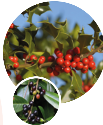
Tipp 1: Stechpalme statt Kirschlorbeer