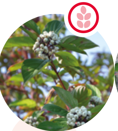
Seidiger Hornstrauch Cornus sericea

Herkunft: Südwestasien Blütezeit: April bis Mai