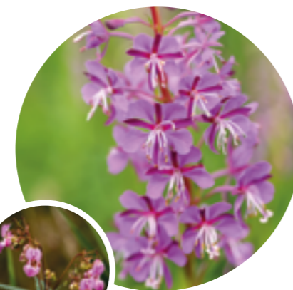
Tipp 2: Wald-Weidenröschen statt Springkraut