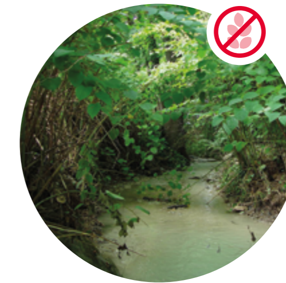
Asiatischer Staudenknöterich verdrängt Vegetation am Bach.

Helfen Sie mit und entfernen Sie exotische Problempflanzen aus Ihrem Garten, damit sich diese nicht unkontrolliert in die Nachbarschaft und in natürliche Lebensräume ausbreiten.