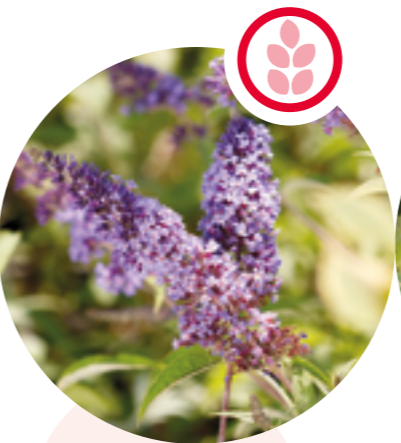
Sommerflieder Buddleja davidii

Herkunft: Nordamerika Blütezeit: Juli bis Oktober