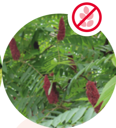
Essigbaum Rhus typhina

Herkunft: Kaukasus Blütezeit: Juli bis September