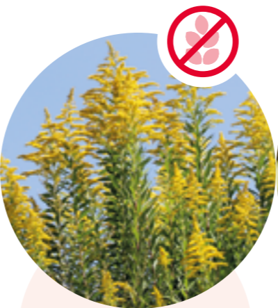
Nordamerikanische Goldruten Solidago canadensis und gigantea

Herkunft: Ostasien Blütezeit: Juli bis September