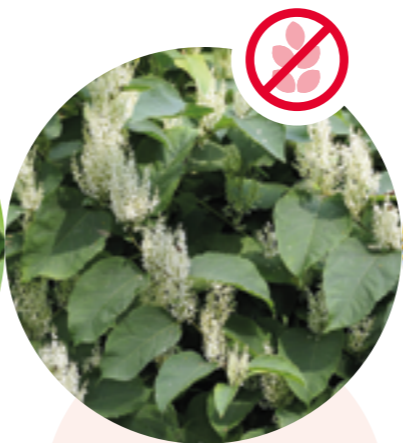
Asiatische Staudenknöteriche Reynoutria japonica, R. sachalinensis etc.

Herkunft: Nordamerika Blütezeit: Mai bis Juni