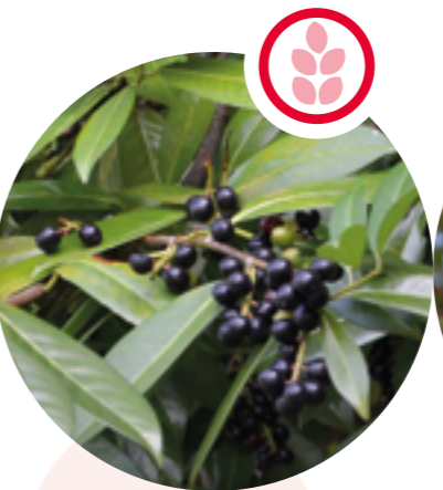
Kirschlorbeer Prunus laurocerasus

Herkunft: China Blütezeit: Juli bis August