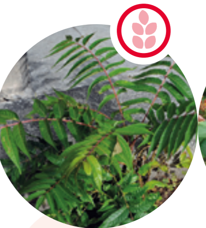
Götterbaum Ailanthus altissima

Herkunft: Nordamerika Blütezeit: Mai bis Juni