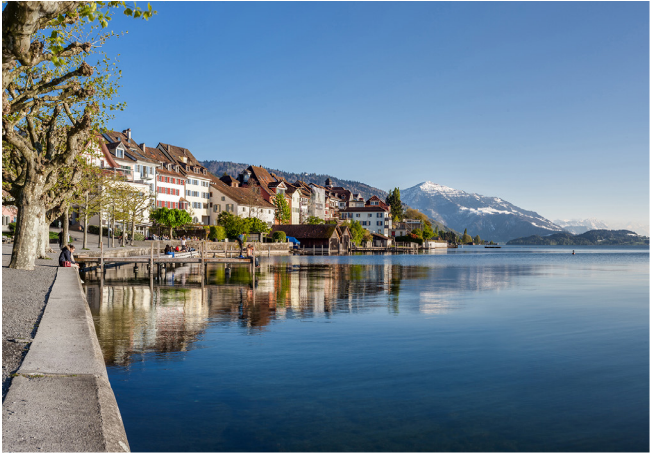
Die Schönheit der Landschaft spiegelt sich im Zugersee. Auch seine Wasserqualität soll so rasch als möglich wieder naturnah werden.

phors im Tiefenwasser. Im Sommer reichert sich das Tiefenwasser jeweils durch die Mineralisierung abgesunkener toter Biomasse mit Phosphor an; im Winter gelangt ein Teil des Phosphors durch die Mischung wieder ins Epilimnion zurück. Gemäss dem Eawag-Bericht 2016 gelangen im Winter aus der Seetiefe 40 Tonnen Phosphor ins Epilimnion – gegenüber 6 Tonnen Phosphor durch die Zuflüsse. Wiederum 40 Tonnen Phosphor sedimentieren im Sommer vom Epilimnion zurück ins Tiefenwasser und 7 Tonnen fliessen via Lorze in Cham aus dem Zugersee. Somit vermindert sich der P-Inhalt des Epilimnions jährlich um 1 Tonne. Diese Bilanz wird sich in den nächsten Jahren kaum ändern.